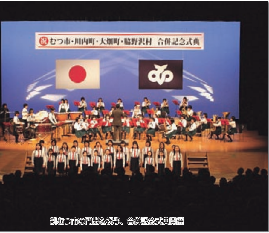
新むつ市の門出を祝う、合併記念式典開催