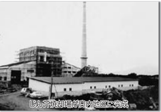
じん芥焼却場が奥内地区に完成