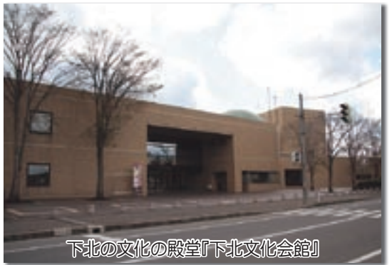
下北の文化の殿堂『下北文化会館』