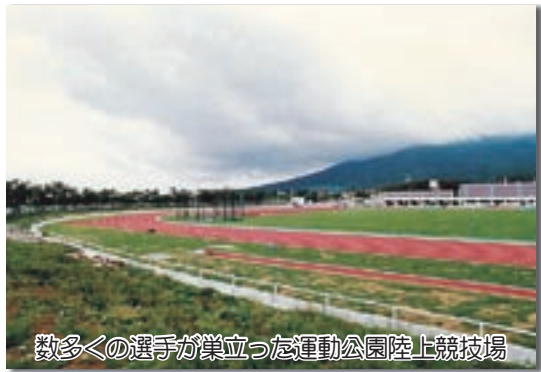
数多くの選手が巣立った運動公園陸上競技場