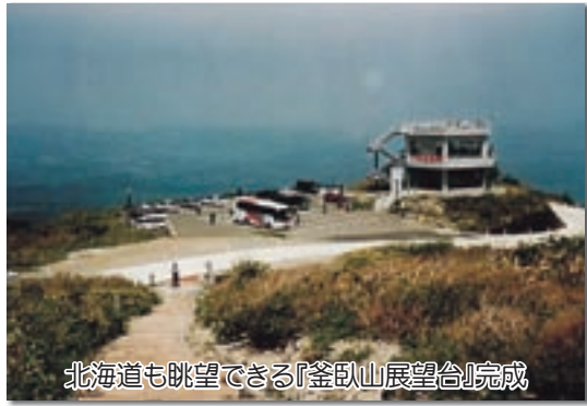
北海道も眺望できる『釜臥山展望台』完成