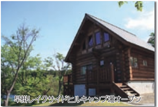
早掛レイクサイドヒルキャンプ場オープン