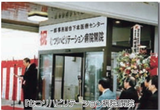
『むつリハビリテーション病院』開院