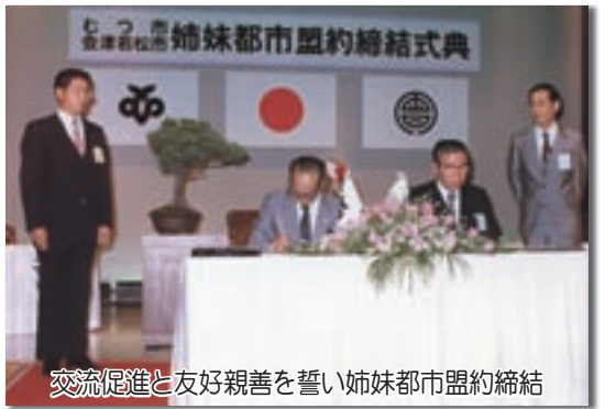
交流促進と友好親善を誓い姉妹都市盟約締結