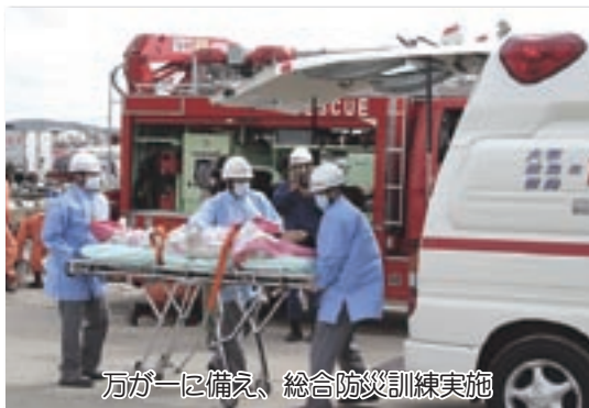
万が一に備え、総合防災訓練実施