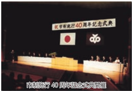
市制施行40周年記念式典開催