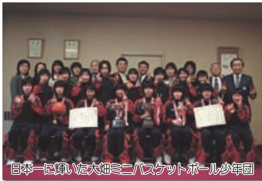
日本一に輝いた大畑ミニバスケットボール少年団