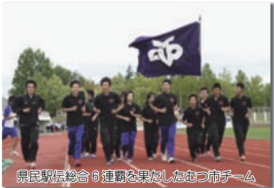
県民駅伝総合6連覇を果たしたむつ市チーム