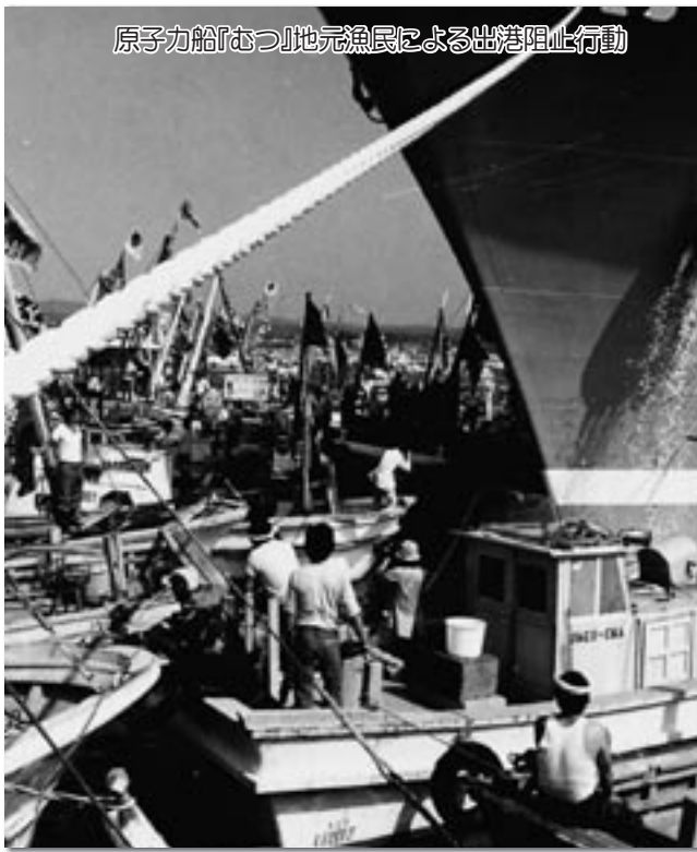
原子力船「むつ」地元漁民による出港阻止行動