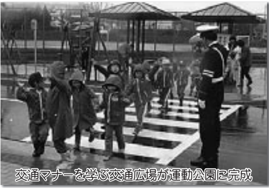
交通マナーを学ぶ交通広場が運動公園に完成

10・14 ◆原子力船「むつ」の定係港入港および定係港の撤去に関する合意協定書を取り交わす