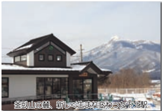
釜臥山の麓、新しく生まれ変わった北北駅