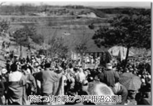
桜まつりで賑わう『早掛沼公園』