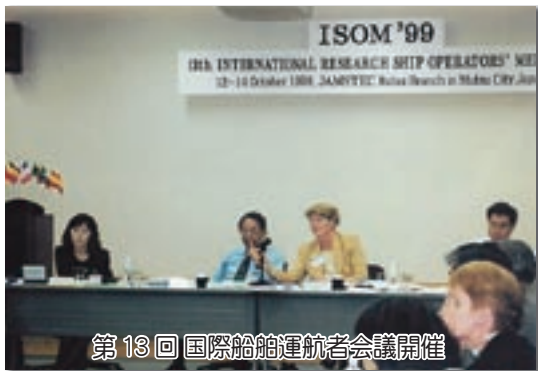
第13回国際船舶運航者会議開催