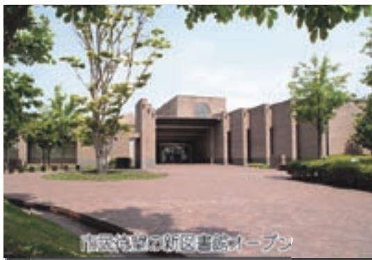
新図書館がオープン