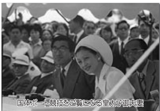
国体ボート競技を鑑みる皇太子御夫妻