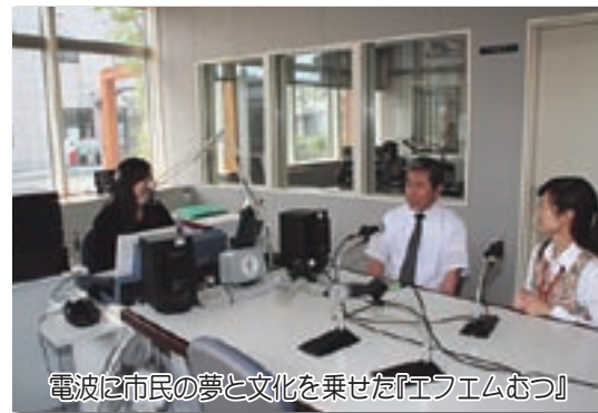
電波に市民の夢と文化を乗せた『エフエムむつ』