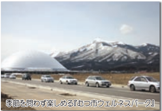
季節を問わず楽しめる『むつ市ウェルネスパーク』