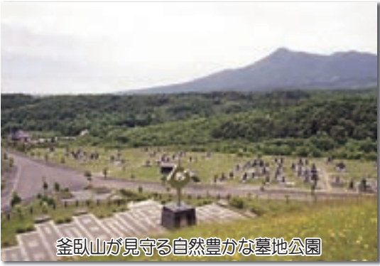
釜臥山が見守る自然豊かな墓地公園