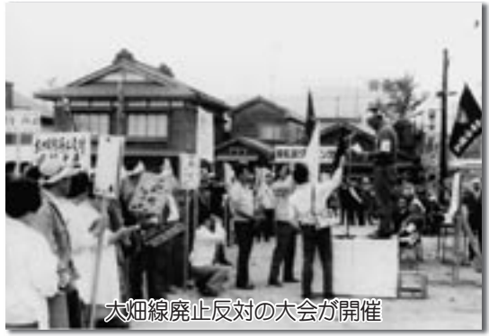
大畑線廃止反対の大会が開催