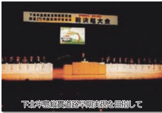
下北半島縦貫道路早期実現を目指して