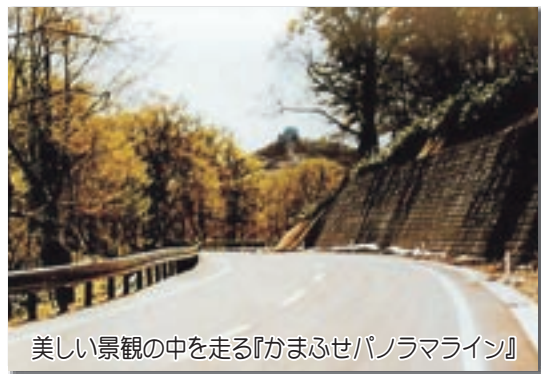
美しい景観の中を走る『かまふせパノラマライン』