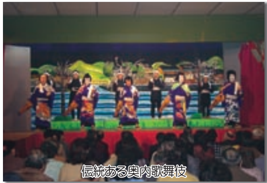
伝統ある奥内歌舞伎