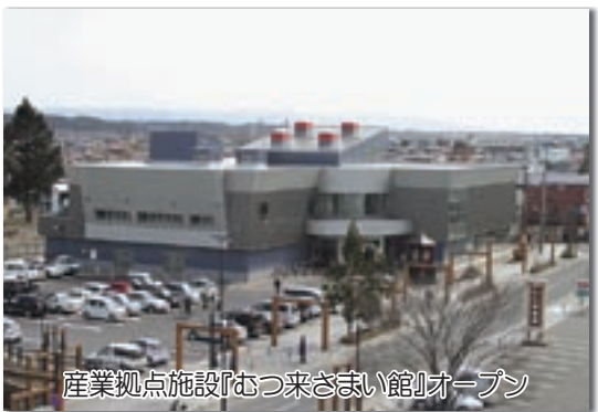
産業拠点施設『むつ来さまい館』オープン