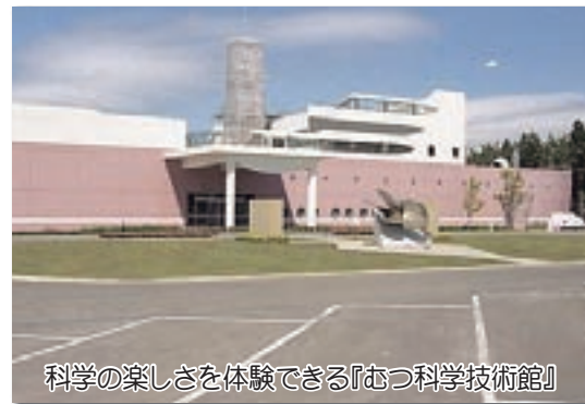
科学の楽しさを体験できる『むつ科学技術館』