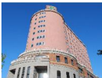
学術交流会館（学生寮）