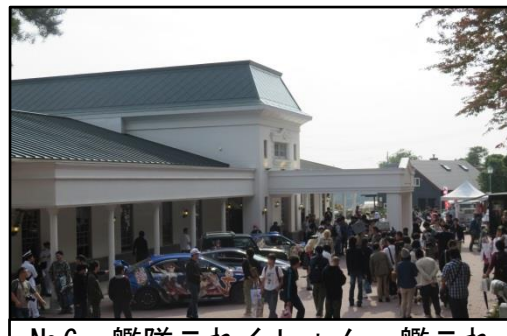
No.6 艦隊これくしょん・艦これ オンリー同人誌即売会