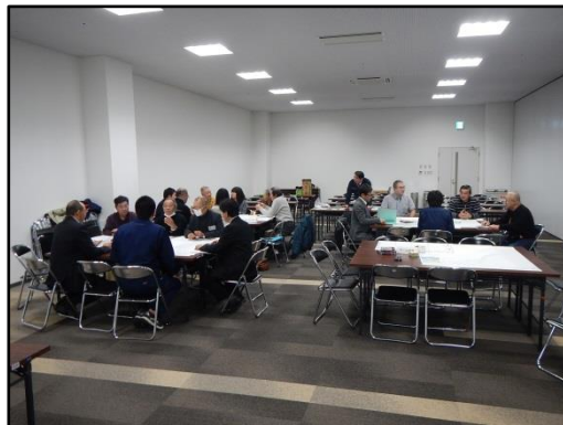
【ワークショップの様子】

まちづくりや事業の実施にあたっては、地域住民・団体との連携を図り、必要に応じ意見交換等を行う。