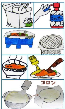
※このイラストは、平成24年に第一田名部小学校の生徒の皆さんが描いてくれたものです。

側溝の清掃、日々の心がけ… 地元住民の様々な取組に感謝 明神川は全長およそ1.5キロメートル。柳町地区から田名部の繁華街を流れ、田名部川へ合流している。かつては上流で女館川とつながり生きものもみられる川だったが、水害対策のために女館川と分断。その後、流域住宅街からの排水により水質が悪化した。