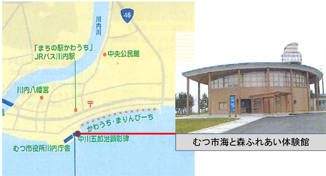
むつ市海と森ふれあい体験館