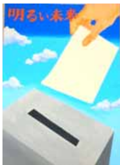
山縣 奏音 八戸工業大学第二高等学校(2年)