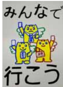
赤坂 晴空 青森市立佃中学校(2年)