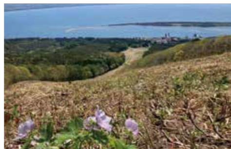
芦崎とシラネアオイ

シラネアオイは先ほども述べたようにとても貴重な花です。もし見かけた際は、決して採取したりせずに、写真を撮って思い出に残し、シラネアオイの成長を見守ってくださいね。