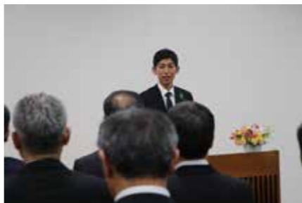
幹部職員へ向けて訓示