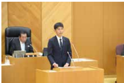
臨時会で施政方針を表明