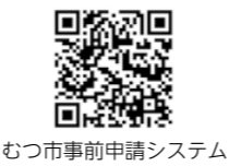
むつ市事前申請システム