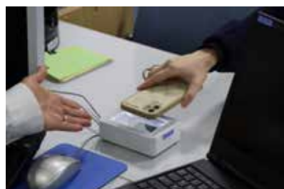
来庁時は二次元コードをかざす