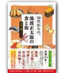
『50代からの、池波正太郎の食と街』 壬生 篤/著(ART NEXT)