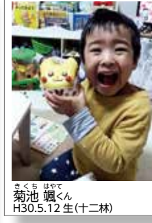
きくち はやて 菊池 颯くん H30.5.12 生(十二林)