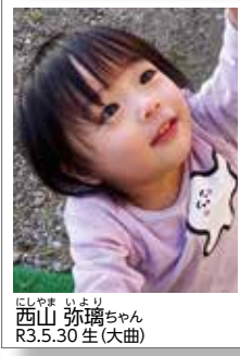
にしやま いより 西山 弥弥ちゃん R3.5.30 生(大曲)