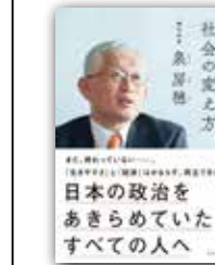
『社会の変わり方』 泉 房穂/著(ライツ社)