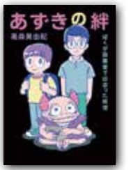
『あずきの絆 ぼくが図書室で出会った妖怪』 高森 美由紀/著、神保 賢志/イラスト(岩崎書店)

市長になったのは、障害を持った弟に対して冷たい社会への復讐だった。就任までの経緯には始まり「明石でできることは全国でできる」を合言葉に自治体から国を変える可能性を提示。日本の政治を諦めてしまった市民への本質を突くメッセージ。