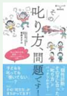
『その叱り方、問題です!』

朱川 湊人 / 著(実業之日本社) なぜ私の幽霊が目の前に? 怪しき博物学者と解き明かす超常現象の謎。あなたはその真相に涙すること間違いなしです。