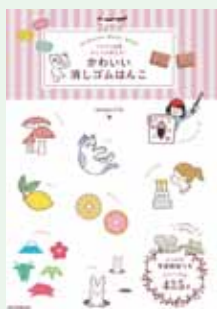
『かわい消しゴムはんこ』

mogerin / 著(朝日新聞出版) 消しゴムはんこの彫り方のポイントが写真付きで紹介されているので、初心者も簡単に彫ることが出来ます。作ったハンコのかわいい押し方などアレンジ例も豊富です。