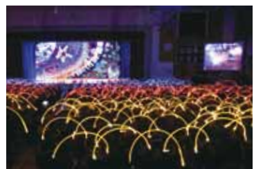
田名部中学校文化祭恒例のペンライト