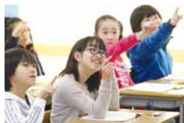
楽しく学ぶ授業の様子

この大綱では「はじめに」の部分で、家庭、学校、地域がそれぞれ果たすべき役割が論じられています。子どもを育てる教育には、家庭教育、学校教育、社会教育、それぞれの連携・協力が不可欠です。しかし、現状では、学校教育に過度な期待が寄せられているようにも感じられ、市民協働と言いつつも、まだまだ地域で家庭や学校を支える取組が少ないように思います。その意識を変え、盛り上げていく取組を期待しています。 むつ市教育大綱の理念に基づき、今後、ますますむつ市の学校教育が充実発展していきけるよう、誠心誠意努力してまいります。