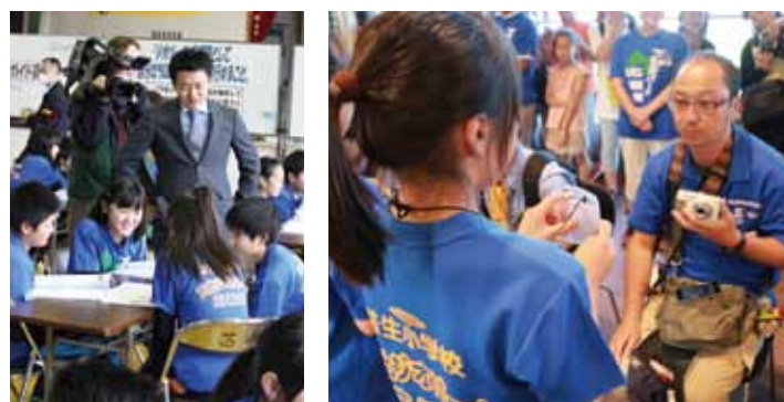
上 ジオパーク応援隊のTシャツを着て、真剣に授業に耳を傾ける子どもたち。 左下 宮下市長をゲストティーチャーとして迎えた授業。ジオパーク応援隊として、自分たちにできることを話し合った。 右下 現地審査に訪れた審査員へ、ジオパーク構想PR活動の報告。子どもたちの熱意に審査員の表情も真剣。