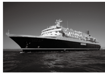
商船三井客船株式会社所有、総トン数2万2472ト、全長166.6m、船客定員524名