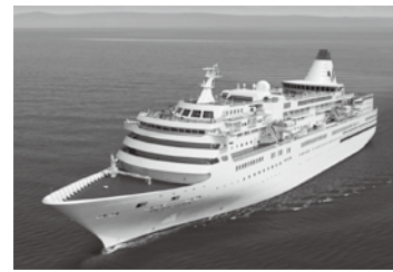
日本クルーズ客船株式会社所有、総トン数2万6594ト、全長183.4m、船客定員620名