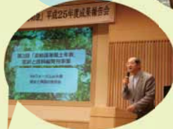
原始謾筆風土年表 意識・資料集発刊(成果報告会から)