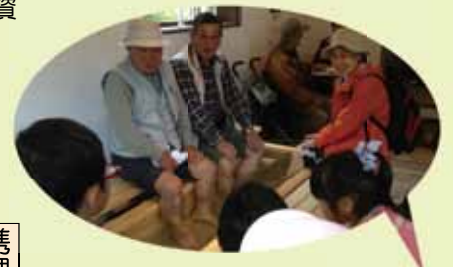
薬研地区コミュニティ・カフェ