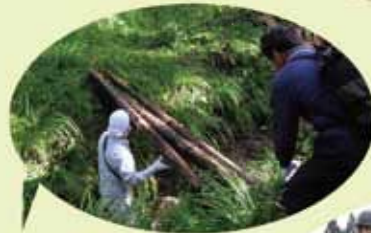
於法岳登山道整備