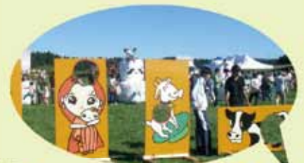
斗南丘こどもまつり

この制度に関する予算は、むつ市議会第223回定例会で審議されることから、予算案の可決をもって正式実施としますのであらかじめご了承ください。