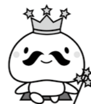
ムッシュ・ムチュラン1世

詳しくは、ゆるキャラ(R)グランプリ2014公式ホームページをご覧ください。登録いただくメールアドレスが、Yahoo!メールやGmail等のフリーメールの場合、登録できない場合があります。