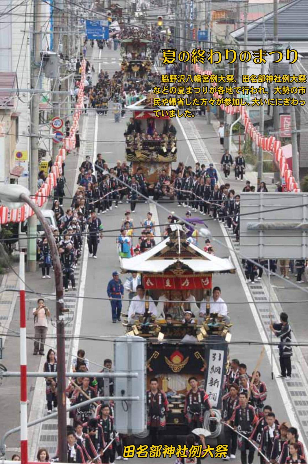
田名部神社例大祭

脇野沢八幡宮例大祭、田名部神社例大祭などの夏まつりが各地で行われ、大勢の市民や帰省した方々が参加し、大いににぎわっていました。