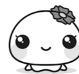
プリンセス・ムチュリン