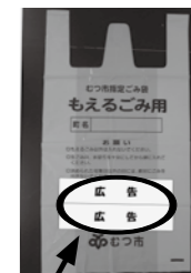
広告掲載予定部分

※市ホームページ上段の『暮らしのガイド』→『ごみ・環境』→『ごみの処理』→『指定のごみ袋に広告を掲載しませんか?』からダウンロードできます。