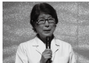
医師から禁煙についてのアドバイス