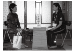
おばあちゃんの相談に市役所へ