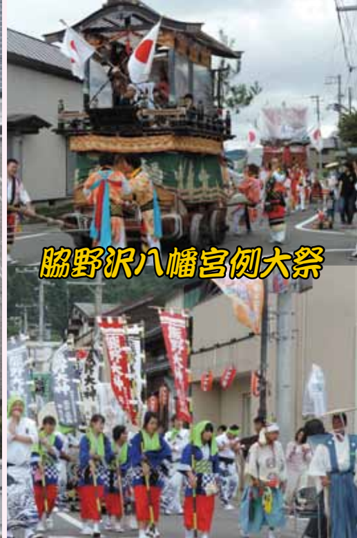
脇野沢八幡宮例大祭