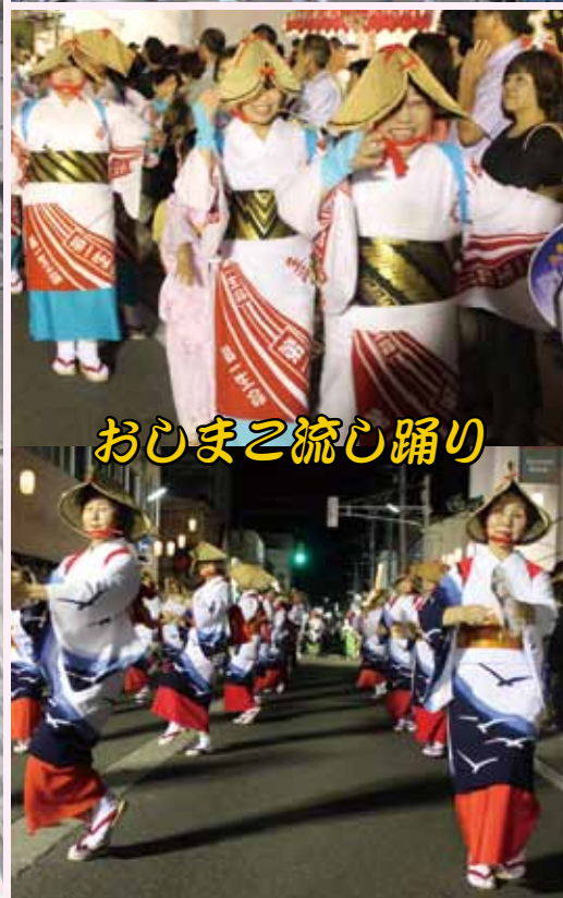
おしまえ流し踊り