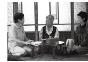
介護サービスを受けるため認定調査員の訪問