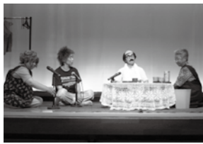
家族で禁煙を説得