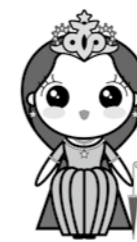
マダム・ムチュリー