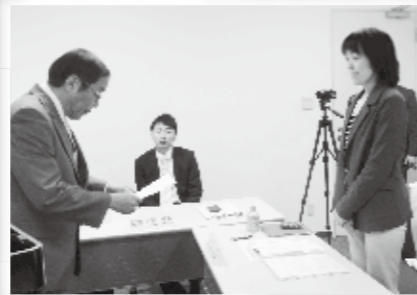
▲市長から委嘱状交付