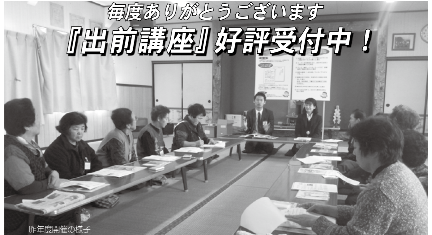
昨年度開催の様子

市では、市民のみなさま主催の集会等に市職員が出向いて、市政に関する事項をわかりやすくお話しする『出前講座』を実施しています。平成20年度の開始以来、町内会や市民サークルなどのさまざまな団体にご注文いただき、昨年度までの6年間で、92団体、3,664名の方にご利用いただきました。