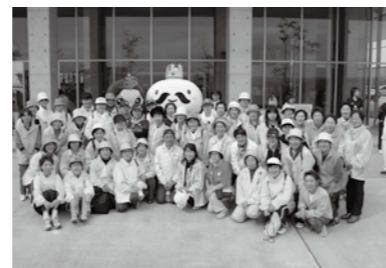
保健協力員の任期は2年で、平成26年4月に任期替えとなります。健康づくりに興味のある方、一緒に活動しませんか？