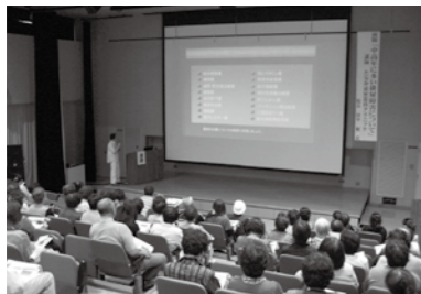
排尿障害についての講演会

保健協力員が中心になり、健康づくりに関する学習会を各地区で開催しています。今回はその様子をお伝えします。お近くで開催する際には、回覧板などのご案内をしていますので、ぜひご参加ください。