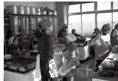
牛乳を使った減塩食についての調理実習