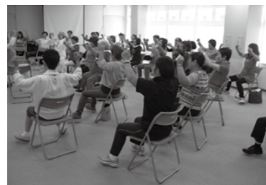
家庭でできる運動の学習会