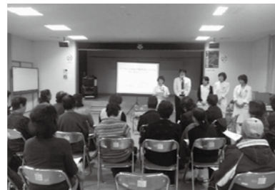
むつ総合病院糖尿病ケアチームを招いての学習会