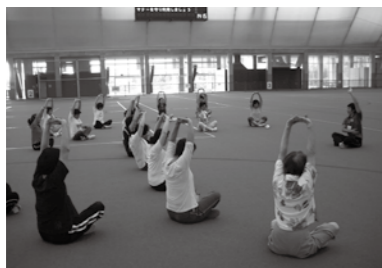
ドームでの運動教室