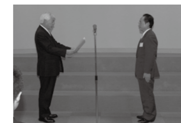
合格者に頭章状を授与

平成24年12月から平成25年8月まで行われた「第2種放射線取扱主任者受験対策講習会」を受講した28名(うち高校生12名)が試験に挑み、見事9名が合格しました。昨年、一昨年に続き、3年連続で現役高校生が合格するという快挙を達成し、合格率32.1%も全国平均30.1%を上回りました。