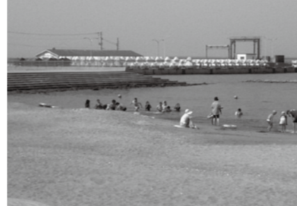
貴重なご意見ありがとうございました。

大畑町海浜公園における火気の使用は禁止されていますので、バーベキュー等での利用はできません。