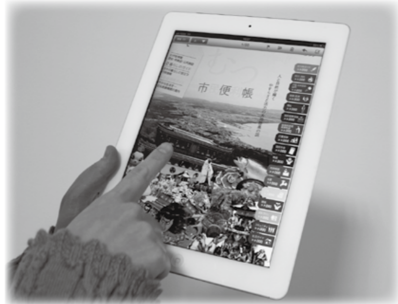
※表紙内容は変更する場合があります。

おつ市民便利帳はA4版、フルカラー、約130ページで、3万2,000部を作成し、来年5月頃の配布を予定しています。