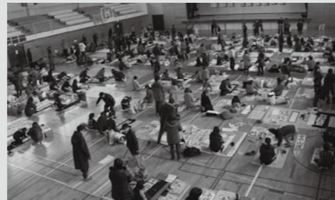
今年1月開催の様子