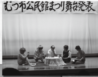
むつ市公民館まつり舞台発表