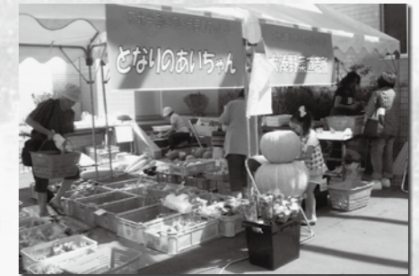
下北半島いきいき産直ネット 21