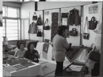
むつ裂織サークル