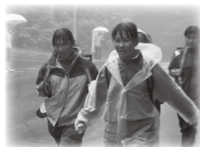
6月17日(日)の小中合同による耐久遠足は、雨天により中学生のみによる実施となりました。

このような強力な支援体制は、今後もむつ中ブロックの大きな力になると期待されます。次年度の実施が今から楽しみです。