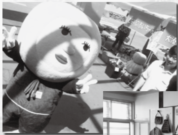
みちのく荘 総合ケアセンター