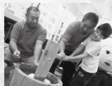
公民館振る舞い餅づくり