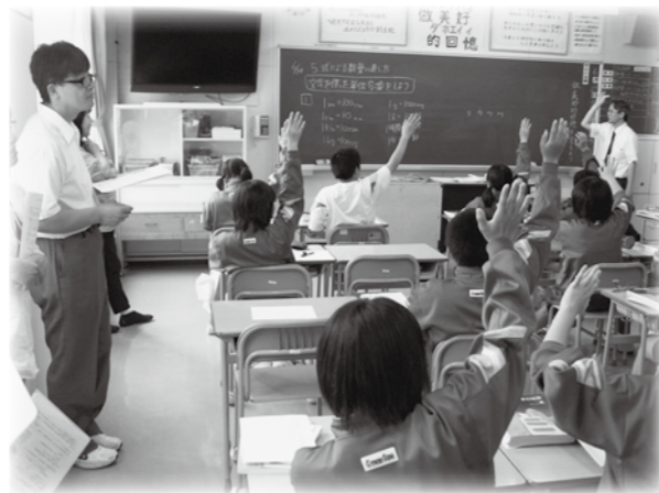
授業研究会の様子。今春、むつ中学校に進学した教え子たちの成長ぶりに、第一田名部小学校の先生方も目を細めていました。