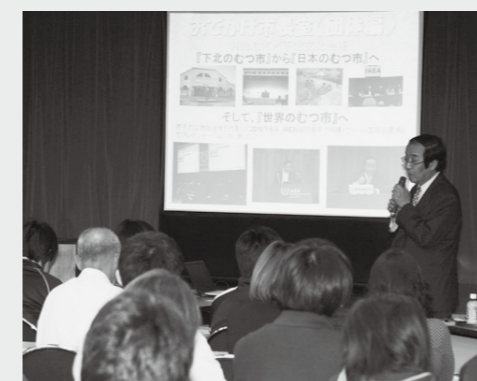
みちのく福祉会様からお申し込みいただき 昨年度開催された“団体編”の様子

市では、「おでかけ市長室」 “各種団体編” の参加団体を募集しています。文化・スポーツ・ボランティア等各種団体の開催する総会や会議に合わせ、市長がみなさまの声を伺いに出向きます。希望される団体は、お気軽にお問い合わせください。