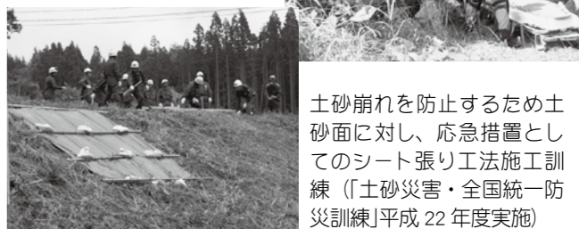
土砂災害により倒壊した家屋からの被災者救助・救出訓練の様子(「土砂災害・全国統一防災訓練」平成22年度実施) 土砂崩れを防止するため土砂面に対し、応急措置としてのシート張り工法施工訓練(「土砂災害・全国統一防災訓練」平成22年度実施)