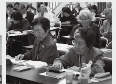
【写真】時折辞書で調べながら詩を詠む参加者のみなさん。