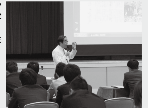
4月20日に開催された “団体編”おつ青年会議所版の様子

事前のお申し込みは必要ありませんが、特に詳細な説明や回答を求めるものについては、資料準備の都合上、7月5日（木）までにメール、FAX等でお知らせください。