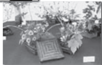
〈詳しくは〉 むつ来さい館 ☎33-8191