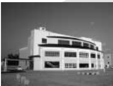
下水浄化センター