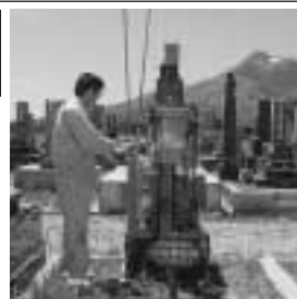
下北で初めての地盤調査

☆墓石のデザインで重量が変わります。弊社では頑丈な基礎を作るために地盤調査のデータに基づき設計をします。納骨室 般若心経の経典が金文字で彫刻されご供養にお薦めしたい納骨室です。