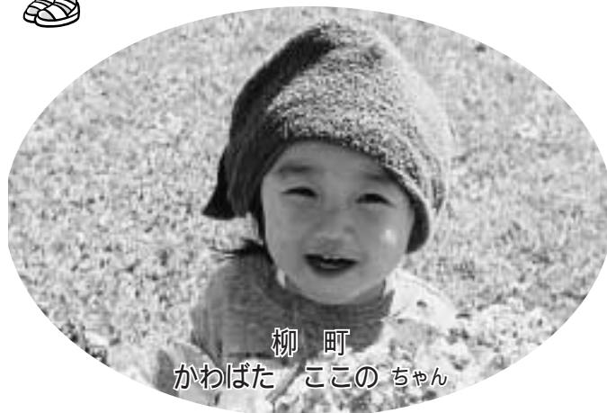
柳町 かわばた ここの ちゃん

むつグループミーティング アルコール依存症と診断された方の回復のための自助グループです。アルコールの問題のある本人だけでなく、どなたでも参加できるオープン形式のミーティングです。場所は市民館。お問い合わせは下北地方健康福祉こどもセンター。☎24-1231