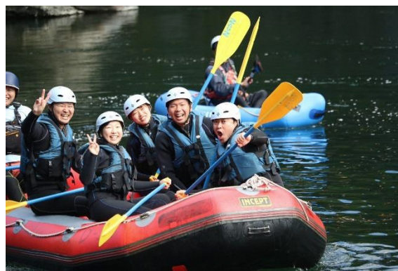
ラフティング体験