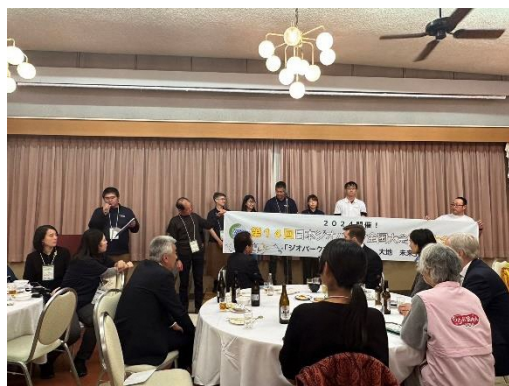
全国大会の交流会

長瀬町を流れる荒川でのラフティング体験にも参加し、ガイドさんの安全管理やゲストの楽しませ方などについても学ぶことができ、内容の濃い3日間を過ごすことができた。