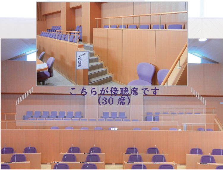
こちらが傍聴席です (30席)