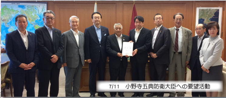
7/11 小野寺五典防衛大臣への要望活動