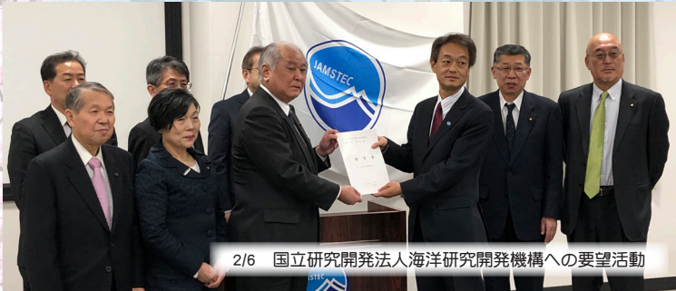
2/6 国立研究開発法人海洋研究開発機構への要望活動