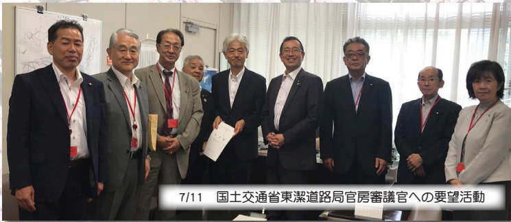
7/11 国土交通省東海環道局官房審議官への要望活動

また、2月6日には、野呂副議長ほか6名の議員が国立研究開発法人海洋研究開発機構（JAMSTEC）横須賀本部と海上自衛隊掃海隊群司令部（いずれも神奈川県横浜