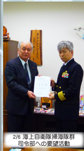
2/6 海上自衛隊掃海隊群司令部への要望活動

須賀市）を訪問し、それぞれ③「みらい」の存続と北極域研究船について、④陸奥湾における掃海訓練の継続実施について、要望書を提出いたしました。 むつ市議会は、今後もこれらの4項目の実現に向けて積極的に取り組んでいきます。